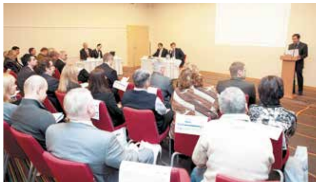
Формирование персонального состава Советов Партнерств будет продолжено на следующих общих собраниях

На состоявшихся 10 декабря 2013 года общих собраниях НП «СРО «Объединенные производители строительных работ» и «СРО «Объединенные разработчики проектной до-