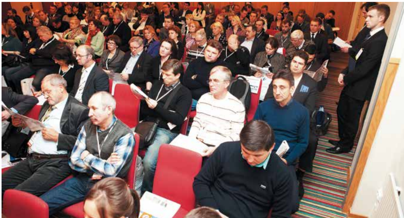
Одним из самых острых для собравшихся оказался вопрос, касающийся размеров вступительного и регулярных взносов