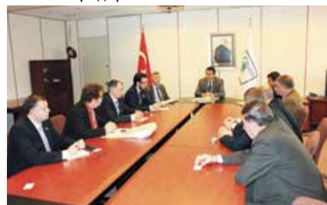
В Министерстве экономики Турецкой Республики рассматривались вопросы, связанные с возможностями реализации комплексных региональных строительных проектов в России с турецким участием

3 декабря состоялись переговоры с руководителями Союза работодателей в секторе строительства и инженерных коммуникаций (INTES), в ходе которых была сделана презентация НП «СРО «ОПСР» для потенциальных партнеров. С турецкой стороны присутствовало более 50 представителей крупных многопрофильных строительных предприятий.