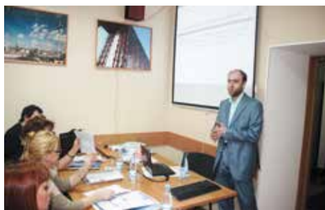
Семинар проводился в виде деловой игры: участники, разделившись на группы, активно обсуждали темы, предложенные ведущим

20–21 февраля в офисе Партерств состоялся обучающий семинар на тему «Внедрение и сертификация на предприятии систем менеджмента по стандарту ISO 9001 и их дальнейшее развитие», участие в котором члены Партерств могли принять бесплатно.