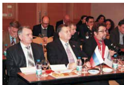
В ходе поездки представителям Партнерств удалось обсудить возможности сотрудничества с крупнейшими турецкими организациями строительной отрасли

Цель поездки – привлечение иностранных инвестиций для реализации проектов, курируемых членами Партнерств. Все мероприятия были организованы при поддержке турецкой стороны, при этом бюджет саморегулируемых организаций использован не был.